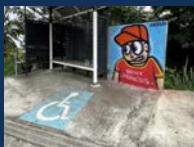
147 route des Azalees, Saint-François