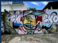
9 boulevard Doret, Sainte-Clotilde