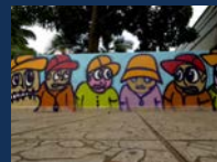
147 route des Azalees, Saint-François