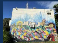
40 route de Saint-François, Saint-François