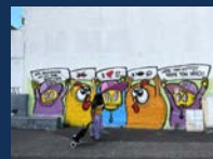
121 boulevard Jean-Jaurès