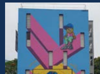
26 rue du Château Morange, Camélias