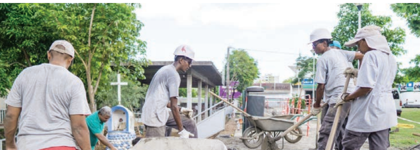
Atelier Chantier d'Insertion d'embellissement au lavoir de la Providence

Secteur économique incontournable à La Réunion, le Bâtiment attire de nombreux Dionysiens. A travers la formation et l'embauche de jeunes Dionysiens sur le chantier du nouveau complexe dédié au bien-être de 15000 m 2 Centre Indoor Primat, la Ville illustre le travail réalisé conjointement avec ses partenaires entreprises au bénéfice de la population. S'agissant de ce chantier, 11 recrues ont pu être intégrées à ce projet pourvoyeur d'emplois pérennes.